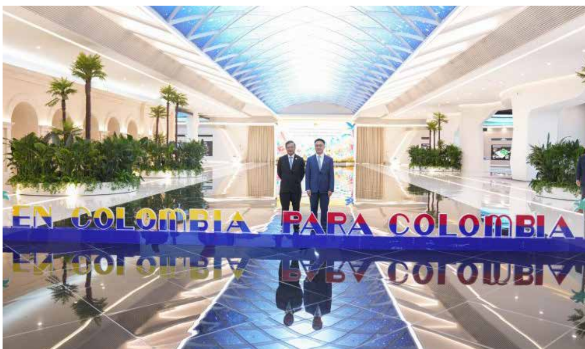
El presidente Petro y el Gerente General de Huawei