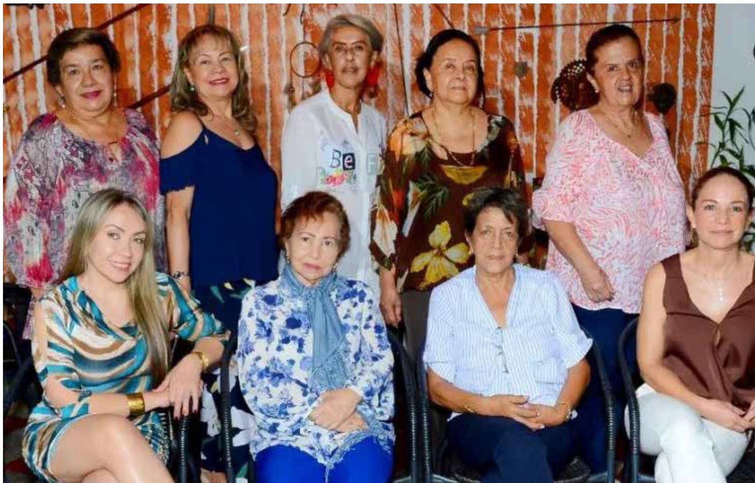
Asociación Damas de la Caridad de Tuluá

El 13 de mayo de 1955 Tuluá era un hervidero de angustias y necesidades. Cinco años de continua violencia.