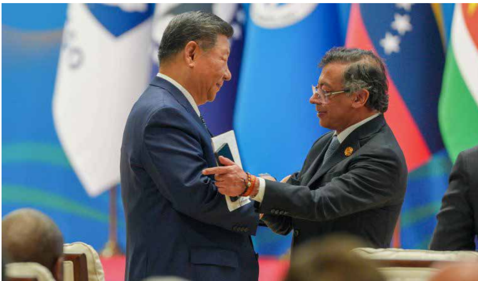
Los presidentes Gustavo Petro y Xi Jinping han dado inicio al proceso para la incorporación de Colombia a la Iniciativa de la Franja y la Ruta.

Durante su declaración a medios, el presidente Petro enfatizó la visión de Colombia de asumir un rol protagónico en la transformación digital a nivel mundial. «Vamos a firmar la adhesión a la Ruta de la Seda. Tanto América Latina como Colombia somos libres, soberanos, independientes, y las relaciones que establecemos con cualquier pueblo del mundo deben darse en condiciones de libertad e igualdad», afirmó, subrayando la importancia de la autonomía en las relaciones comerciales y de cooperación internacional. Petro, quien también ejerce la presidencia pro tempore de la Comunidad de Estados Latinoamericanos y Caribeños (Celac), destacó la posición geográfica estratégica de la región. «Por nuestra posición geográfica, queremos que América Latina sea el corazón del mundo social, político y económico. Y Colombia, por su condición interoceánica con Panamá, puede jugar un papel aún más central»,