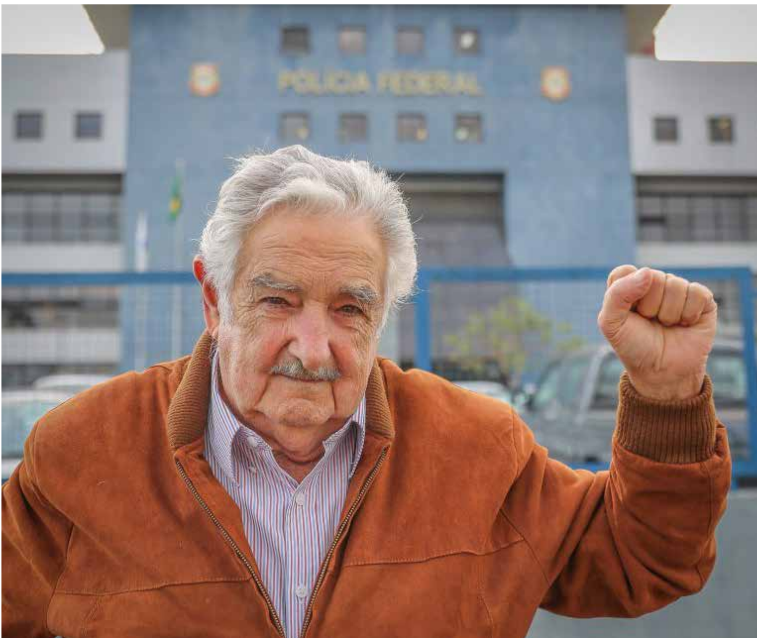
José Alberto «Pepe» Mujica Cordano 1935-2025

Tras la restauración de la democracia en Uruguay en 1985, Mujica fue liberado y se reintegró a la vida política. Junto a otros ex-tupamaros, fundó el Movimiento de Participación Popular (MPP),