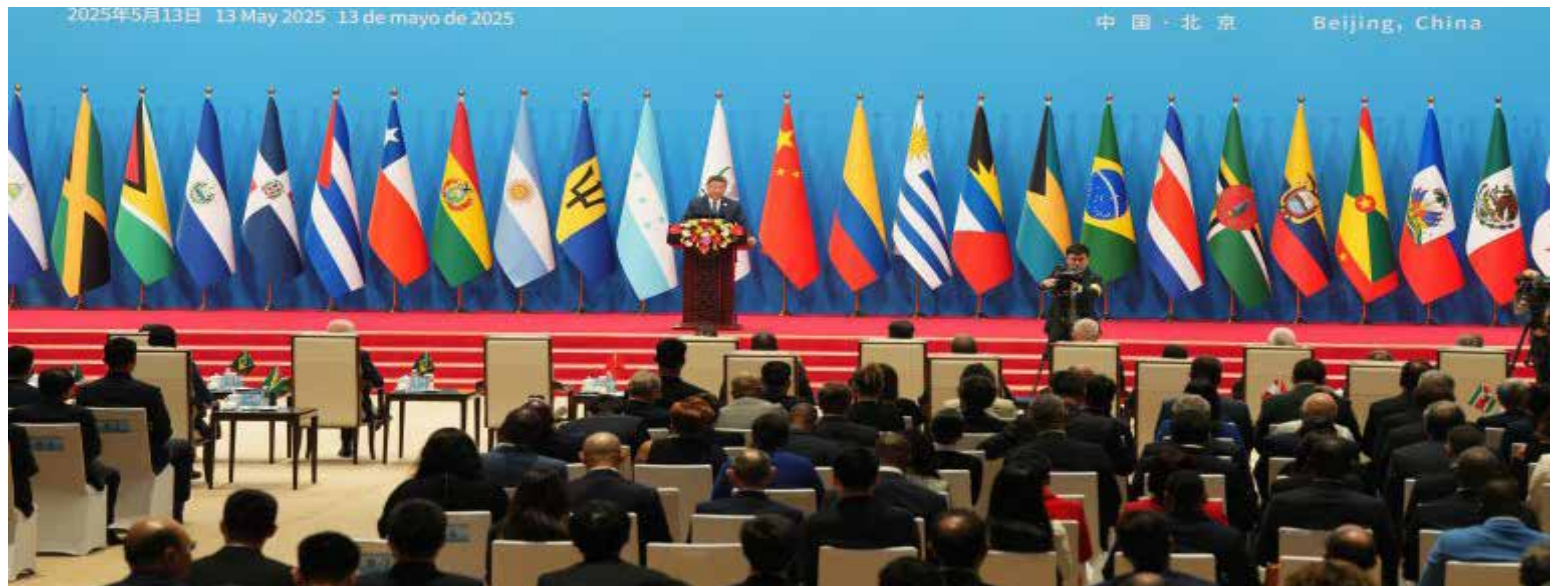
«En un mundo en transformación, con riesgos interconectados, China apuesta por la unidad, la cooperación y el respeto mutuo»: Xi Jinping, presidente de la República Popular de China.

Durante su discurso ante los representantes latinoamericanos y caribeños, Xi Jinping enfatizó la visión de China en un contexto global marcado por la incertidumbre. «En un mundo en transformación, con riesgos interconectados, China apuesta por la unidad, la cooperación y el respeto mutuo», declaró, delineando una filosofía de asociación que contrasta con las dinámicas de confrontación. Su llamado a los gobiernos sudamericanos a «rechazar las injerencias externas y promover una autonomía regional» resonó como un eco de las