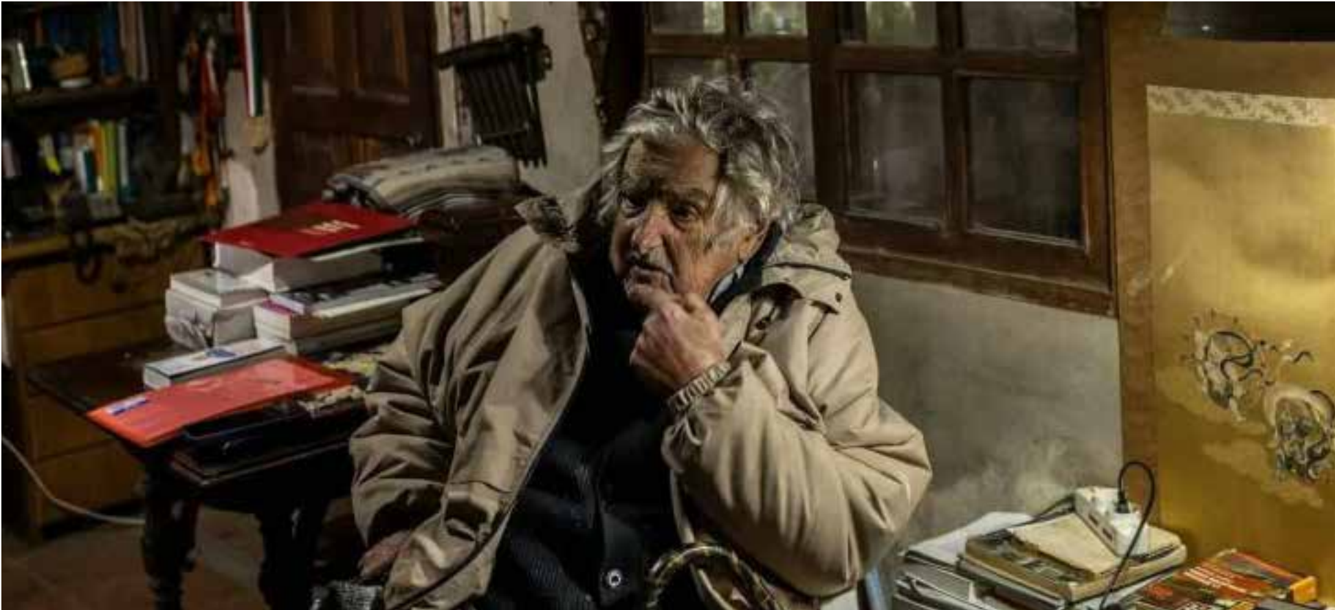
La filosofía de Mujica se centró en la importancia de la sencillez, la solidaridad y la lucha por un mundo más justo.

mundo, inspirando a personas de diversas ideologías. Algunas de sus frases más memorables incluyen: