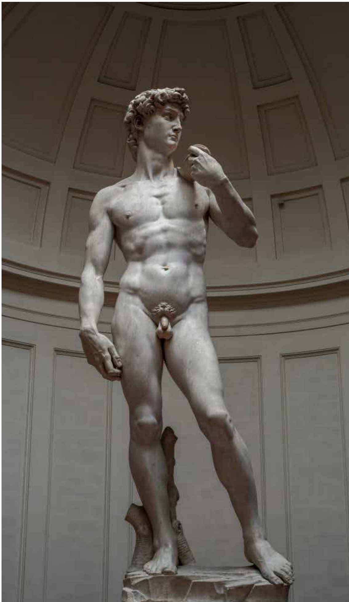
David (1501-1504), de Miguel Ángel, Galería de la Academia de Florencia